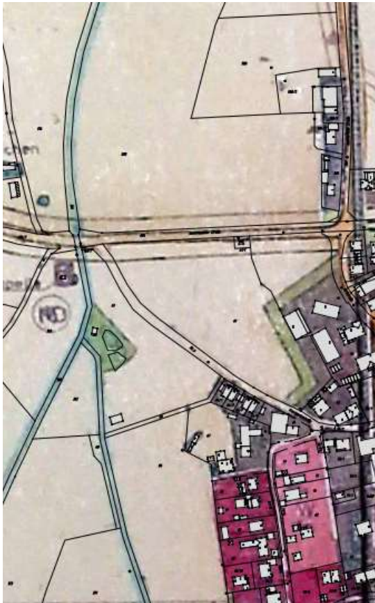
Abb. 3: Auszug aus dem genehmigten Flächennutzungsplan der Gemeinde Weil; ohne Maßstab