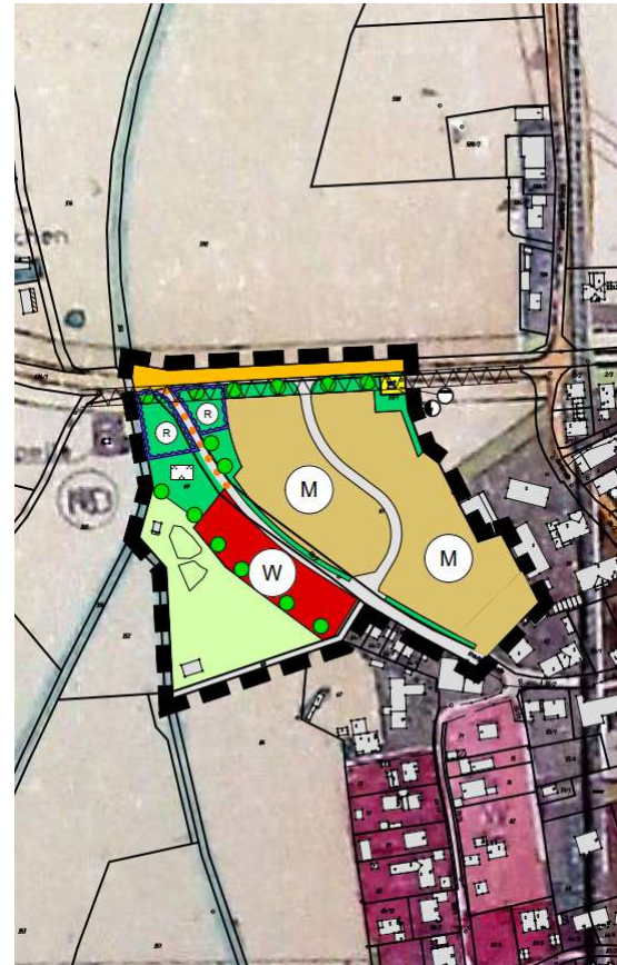
Abb. 4: Auszug aus der 8. Änderung des Flächennutzungsplans im Parallelverfahren; ohne Maßstab

Dieser wird daher im Parallelverfahren gem. § 8 Abs. 3 BauGB geändert. Der Aufstellungsbeschluss zur 8. Änderung des Flächennutzungsplans wurde vom Gemeinderat ebenfalls in seiner Sitzung am 14.11.2023 gefasst.