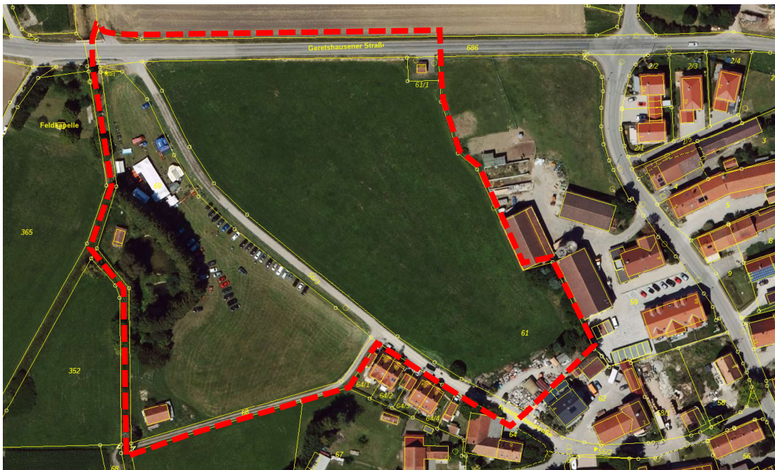
Abb. 1: Auszug aus dem BayernAtlas der Bayerischen Vermessungsverwaltung, Stand Februar 2024, mit Kennzeichnung des Geltungsbereichs, ohne Maßstab

Das Plangebiet ist wie folgt umgrenzt: im Norden durch die Geretshausener Straße (Kreisstraße LL7), im Osten durch die bestehende Bebauung westlich der Dorfstraße, im Süden durch die Krautgartenstraße und den bestehenden Feldweg FI.Nr. 68 und im Westen durch den Loosbach. Es umfasst die FI.Nrn. 61, 61/1, 68, 69 und 69/1 zur Gänze sowie Teilflächen der FI.Nrn. 56/3 (Krautgartenstraße) und 686 (Geretshausener Straße), alle in der Gemarkung Schwabhausen gelegen, mit einer Größe von rund 3,21 ha.