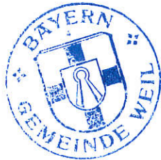
Christian Bolz Erster Bürgermeister