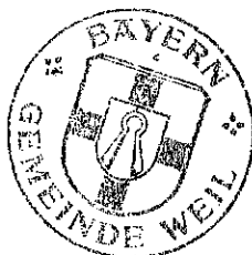
Christian Bolz Erster Bürgermeister