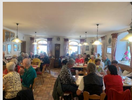
(Text u. Bild: Birgit Gahlert)

Für Beratungen aller Art stehe ich gern zur Verfügung. Vereinbaren Sie einen Termin, gerne komme ich auch zu Ihnen nach Hause. Ich freue mich auf Sie.