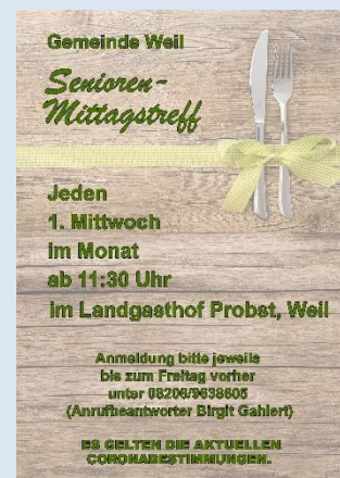
(Text u. Bild: Nicole Hafner)

Zu jedem Termin wird um vorherige Anmeldung bei Frau Gahlert gebeten. Unter Tel. 08206/9638605 kann jeweils bis zum Freitag vor dem monatlichen Seniorentreff eine Nachricht auf dem Anrufbeantworter hinterlassen werden. Die Organisatorinnen freuen sich über eine rege Teilnahme und schöne gemeinsame Momente. Die jeweils geltenden Coronabestimmungen sind einzuhalten.